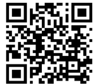
令和3年度表彰式 ダイジェスト版

インピットでは、ワークショップ参加後も発明の疑問に オンライン相談会でお答えします！お気軽にご相談ください！